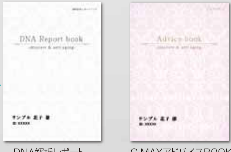
DNA解析レポート G-MAXアドバイスBOOK

あなただけの一生変わらない健康と美容に関する情報を分かりやすくまとめたBOOKをお届けします。